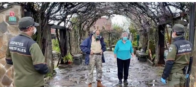
ASISTENCIA A RESIDENTES EN VIVIENDAS AISLADAS POR PARTE DE LOS AGENTES FORESTALES DE LA COMUNIDAD DE MADRID

2020 resultó ser un año complicado para todos y los agentes forestales nos tuvimos que adaptar al medio y a las nuevas condiciones, aunque estuvimos en disponibilidad buena parte de la primavera cuando tocaba comarca añadimos nuevas tareas... y nos acordamos más que nunca de los paisanos que vivían más lejos de las poblaciones, de los mayores, de los más vulnerables en general... así nuestra labor social se potenció más que nunca.