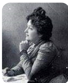
Carmen de Burgos