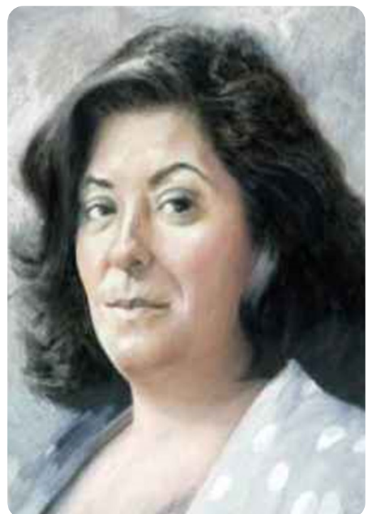
Retrato de Almudena Grandes